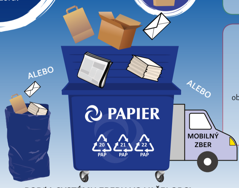
PODĽA SYSTÉMU ZBERU VO VAŠEJ OBCI