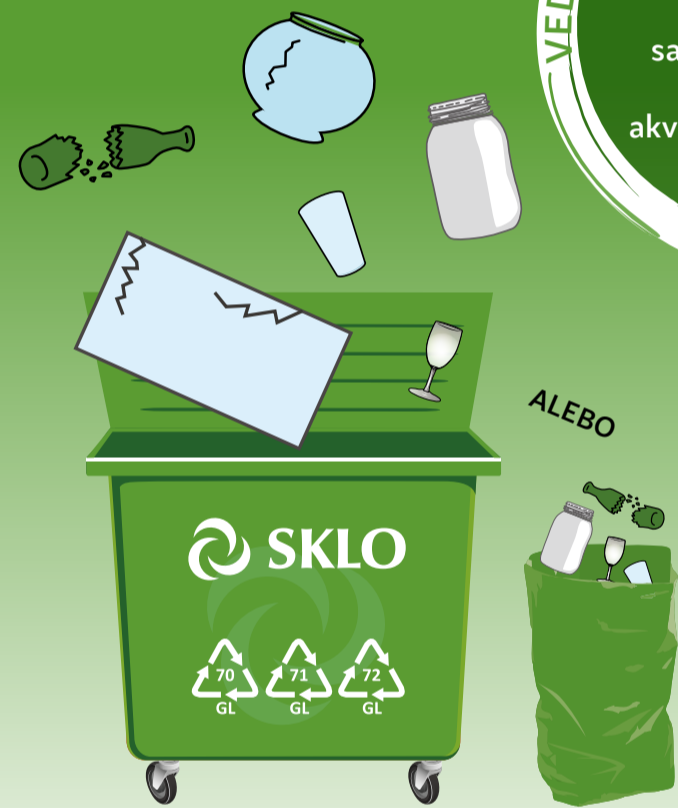
PODĽA SYSTÉMU ZBERU VO VAŠEJ OBCI

VEDELI STE, ŽE... 15 sklenených fliaš sa zmení na akvárium?