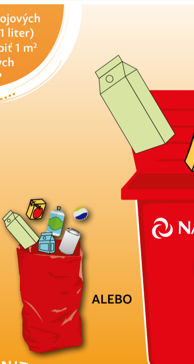
PODĽA SYSTÉMU ZBERU VO VAŠEJ OBCI

VEDELI STE, ŽE... 150 plechoviek sa zmení na panvicu?